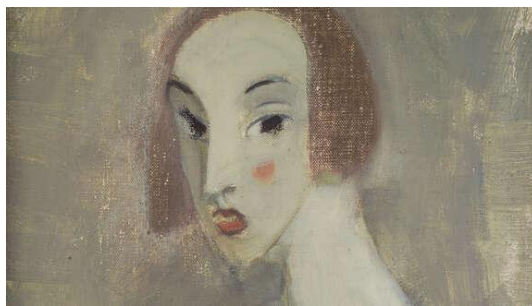
Kuvat: Tapiola Sinfonietta & Matias Uusitalo